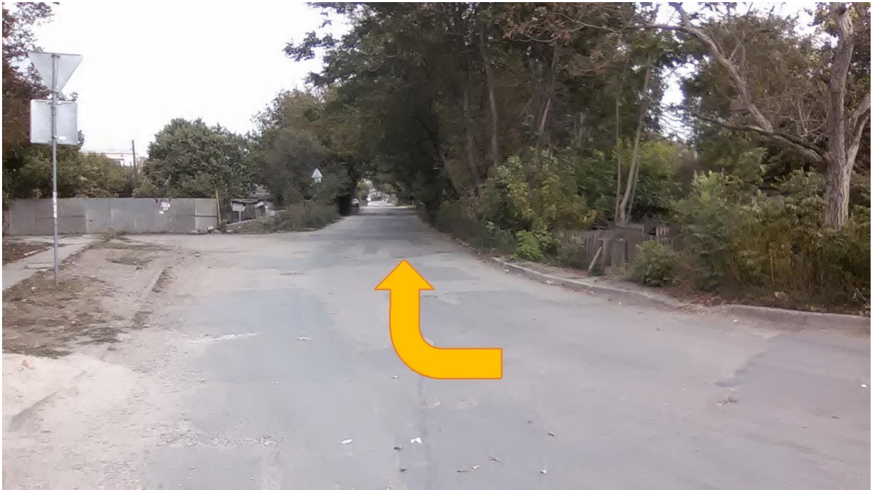
Поворот на ул. Северная